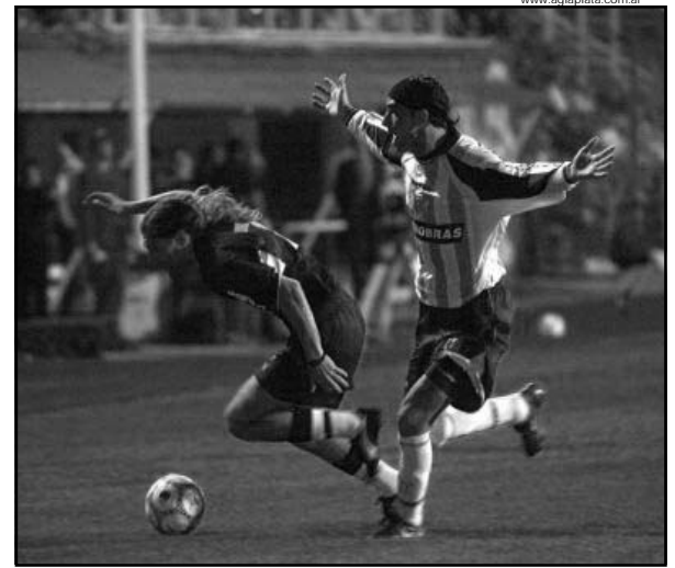
Racing llega al Bosque en plena crisis futbolística