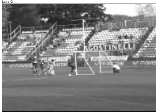
La gente se entusiasmó con las jugadas de gol

El partido tuvo una duración de 20 minutos y pudo verse la alegría de estos jugadores una vez que terminaron su juego. Mas tarde acompañaron al primer equipo de Gimnasia cuando ingresó a la cancha y se sacaron las fotos correspondientes.