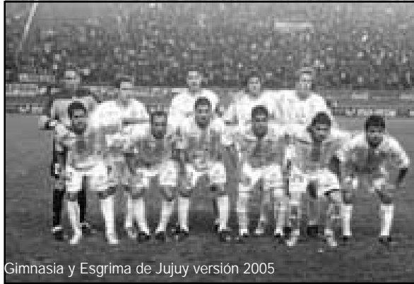
Gimnasia y Esgrima de Jujuy versión 2005

Por el lado de Gimnasia lo más destacado pasa por ver quién será el reemplazante de Lucas Licht (suspendido por doble amonestación en el partido con Argentinos). La posibilidad más factible es que Elvio Fredrich