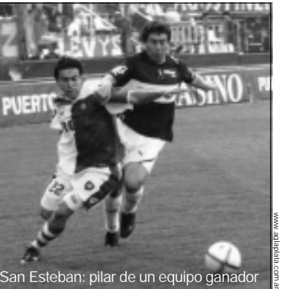
San Esteban: pilar de un equipo ganador

Con la tranquilidad del empate se fue el Lobo a los vestuarios, pero lejos de conformarse salió en el segundo tiempo a llevarse los tres puntos. Al minuto de juego, tras un centro desde la izquierda de Lucas Licht el