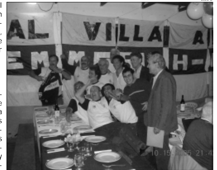
Troglio en el medio de todos los integrantes de la Filial.

Para alimentar el clima festivo de esa noche se hizo presente el técnico albiazul, Pedro Troglio, que posó junto a todos los integrantes de la filial y con todos aquellos que se lo pedían. Fue un breve paso del entrenador que dejó una