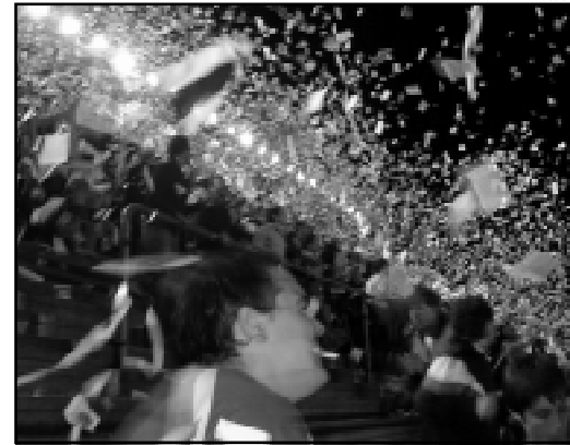
Gran movilización hacia el Estadio Diego Maradona.

Los días fueron pasando y la diagramación del torneo bajó un poco los ánimos. Además el partido frente Ar-