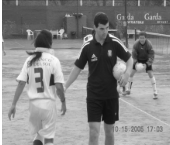
El precalentamiento se hizo en las canchas de tenis

Sin embargo la gente se entusiasmó y no pudo dejar de