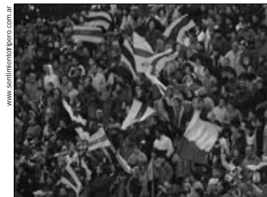
Frente a Boca coparon el bosque