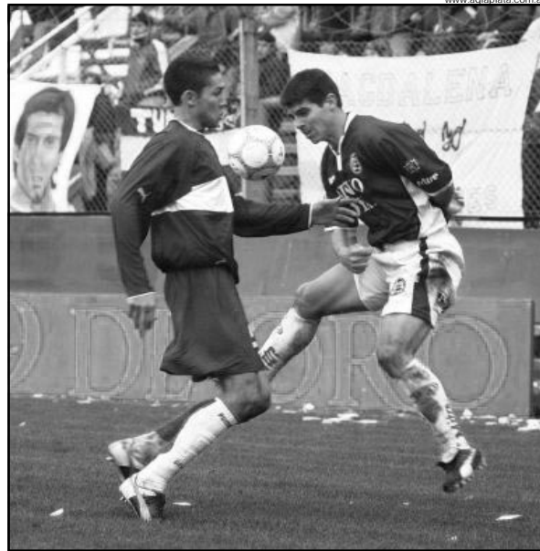
El Lobo no debe perder más puntos de local. Hoy lo visita Lanús.

Por Lanús la duda está en quien reemplazará al expulsado Papparatto, pero los posibles once serán: Bossio; Graieb, Gioda, Hoyos y Velázquez; Aguirre, Filtzler, Marini y Archubi; Graf y Fabbiani.