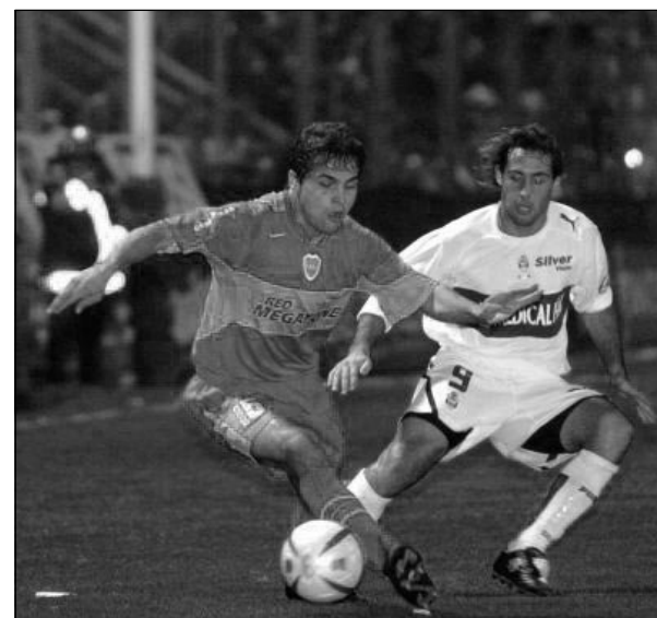
Gimnasia paga muy caro sus errores defensivos

Goles: PT 31 R. Palacio (B); ST 12 F. Insúa (B). Cambios: ST 19' 11- Valenti (3) X Vargas (G); 25' 27- Juan Casado (3,5) X Cervera (G); 26' 8- Cagna X Battaglia (B); 39' 18- Marino X Insúa (B); 44' 16- Delgado X Palacio (B). Amonestados: PT 26' Abondanzieri (B); 36' Cervera (G); 38' Battaglia (B). ST 4' Krupoviesa (B); 17' Palermo (B); 18' González (G) y 35' Cabrera (G). Expulsados: No hubo; Arbitro: J. P. Pompei (6). Partido tranquilo, correcto en las amarillas; Líneas: S. Cagni (6) y C. Roucco (6); Cancha: Gimnasia; Público: 22.000.