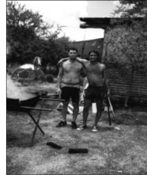
Letra G compartiendo un asado con los amigos cordobeces

Los une el fervor albiazul y sus cotidianidades. Comparten grandes momentos y soledades de inviernos helados. Todos aman al "Vie-