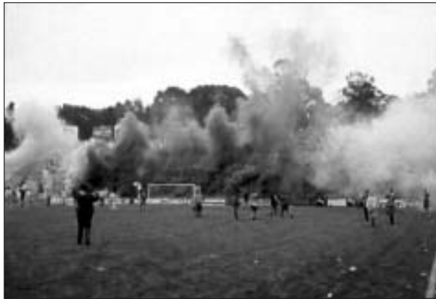
HAY QUE VOLVER A LA SENDA DEL TRIUNFO. LA 22 APOYA SIEMPRE.

Si bien enfrente estará un rival difícil, el apoyo de la gente será importantísimo, los jugadores concentrados en cada pelota, disputando cada una como si fuera la última y mirándose la gloriosa camiseta que llevan puestas encontrarán el camino a la victoria. Hay dos ejemplos claros: el