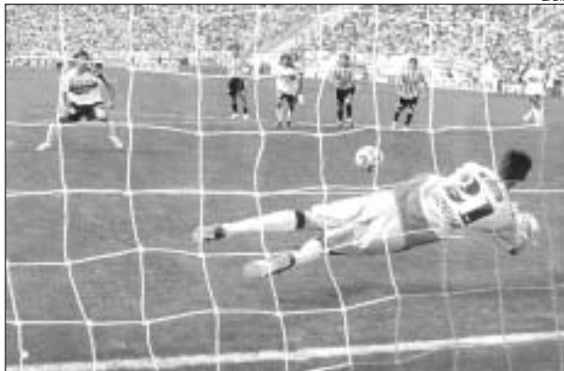
EL ÚLTIMO PARTIDO SE LO REGALÓ GIMNASIA. NO SE PUEDE REPETIR.

Resulta necesario entonces comenzar a capitalizar este extraño