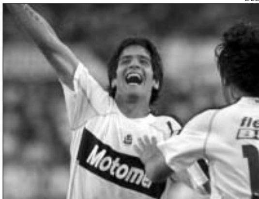
NEIRA CONVIRTIÓ SU PRIMER GOL EN PRIMERA DIVISIÓN.

River llegó al partido muy golpeado y Gimnasia salió a la cancha consciente de su estado de ánimo. Lo atacó durante todo el primer tiempo e