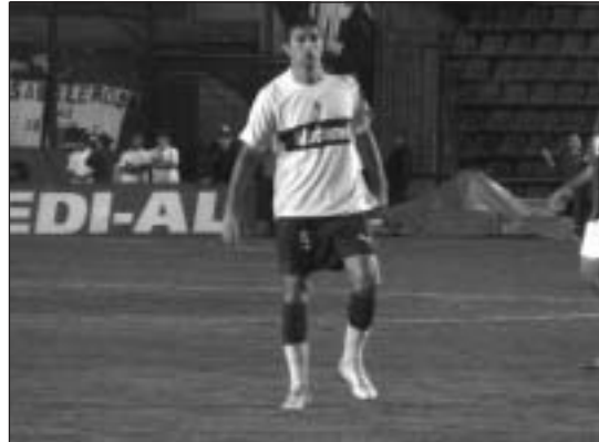
CUANDO EL TORNADO ESTÁ BIEN IMPONE PELIGRO A LOS RIVALES.

El Lobo tuvo chances de ganarlo, pero también de perderlo. Por eso, un punto en Santa Fe no fue un mal resultado. Las figuras fueron Piatti y Escobar, quien estuvo a un paso de volver a convertir.