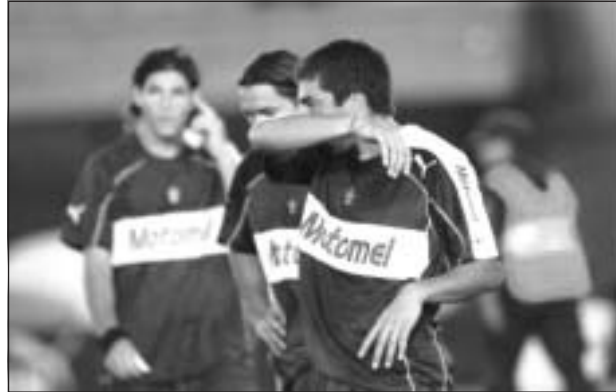
EL COCO SAN ESTEBAN REAPARECIÓ Y MOSTRÓ UN BUEN NIVEL.

El Lobo necesitaba un triunfo, no sólo para sumar de a tres sino también para encontrar tranquilidad. Más allá de los medios, lo que realmente importaba era el fin. Nada de esto sucedió.