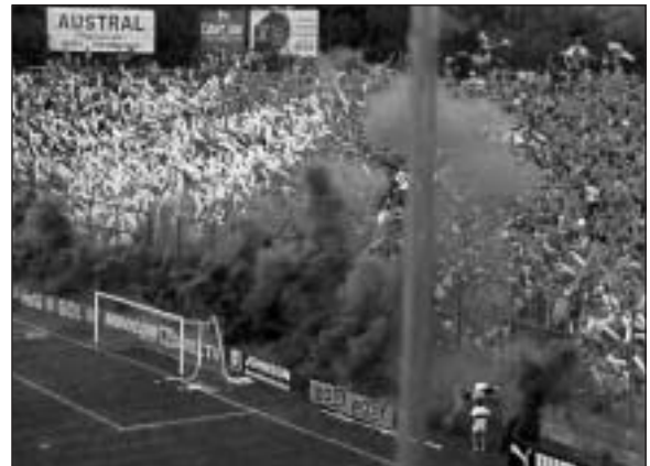
LA 22 SUEÑA CON EL REGRESO Y SE VA A DAR. GIMNASIA LO NECESITA.

De todas formas, hay que seguir. Si no se juega con Olimpo en el Bosque, hay que seguir trabajando para jugar frente a Gimnasia de Jujuy.