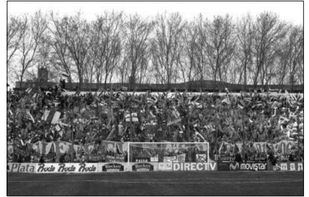
Hubo sólo 8000 personas. La cancha no daba para más

Y estuvieron quienes hicieron varios trapos que unidos y puestos en el alambrado formaban la inscripción “se viene el desalojo 01-01-06”. Además de la cantidad de banderas de palo y los trapos habituales