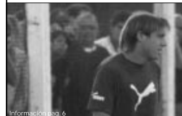
Información pag. 6

A pesar de la lesión de Lobos, Gimnasia tuvo una buena semana de entrenamientos de cara a los próximos compromisos. Hoy tiene la oportunidad de encaminarse.