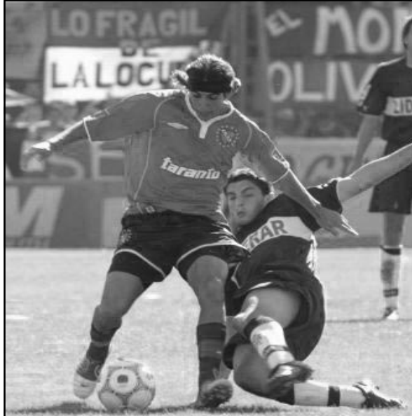
Gimnasia buscará recuperarse frente al "rojo" de Avellaneda