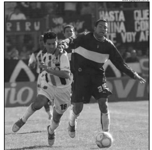
Gimnasia y la posibilidad de alejarse en la tabla de promedios