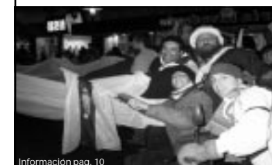
Información pag. 10

"La 22", una vez más, dejó en claro que en la ciudad hay una sola hinchada. El día previo al clásico 138°, la gente copó las calles céntricas con otro banderazo conmovedor.