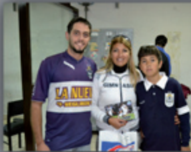
::: Como cada fin de semana, los triperos pasan por la radio a retirar sus premios. Enviando un mensaje de texto cualquier día de la semana al 1919 poniendo LOBO y luego el mensaje participás de los grandes premios que sorteamos.