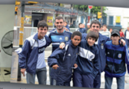
::: La banda de Ensenada siempre presente. Con el apoyo de todos saldremos adelante. Vamos Gimnasia.