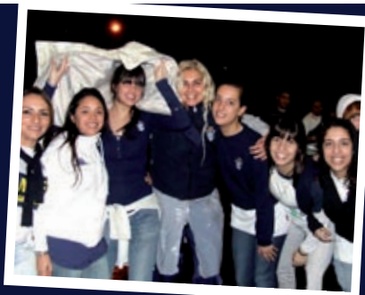
:: TOTALMENTE ACERTADAS, bien por estas chicas, todas entonadas, embanderadas, engamadas en el azul y el blanco