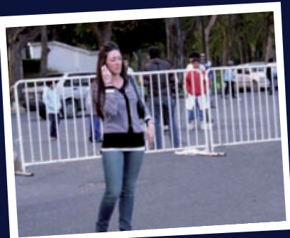
:: Y acá tenemos a la que se equivocó de lugar. ¿Dónde está el look tripero en esta muchacha? No lo sabemos y ella tampoco... VA CON ONDA, A NO ENOJARSE...